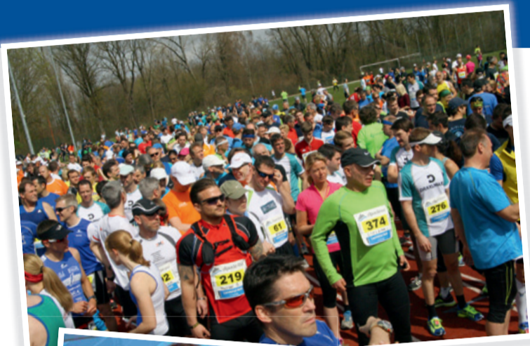
Start und Ziel im Stadion von TV64